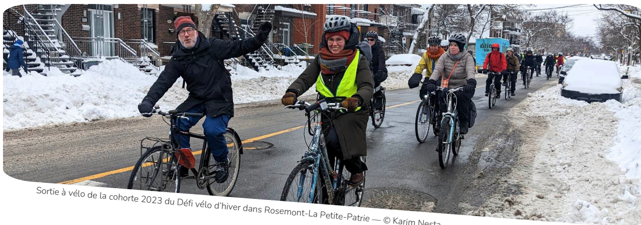
Sortie à vélo de la cohorte 2023 du Défi vélo d'hiver dans Rosemont-La Petite-Patrie