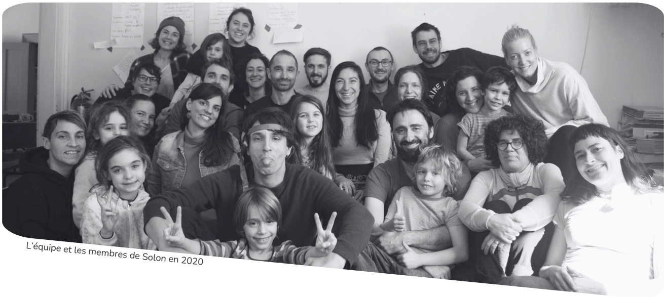
L'équipe et les membres de Solon en 2020