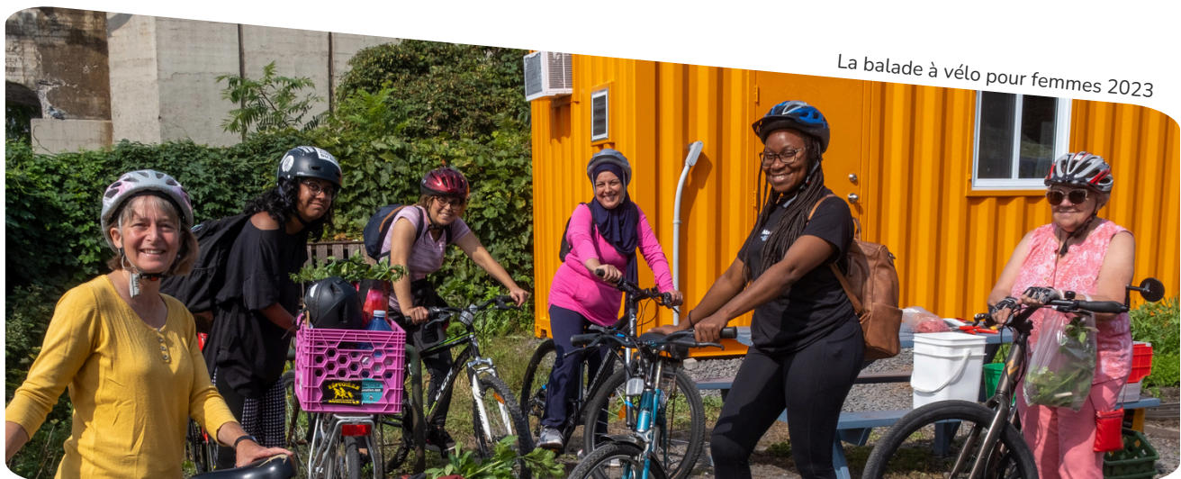
La balade à vélo pour femmes 2023

Après ce diagnostic et la construction d'un plan d'action par le comité EDI, nous avons testé différentes approches à travers nos champs d'activités, et des stratégies ont émergé, qui sont résumées dans notre démarche EDI .