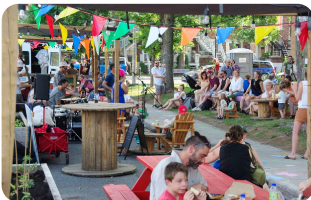
Soirée d'ouverture de la programmation estivale à la Station Youville

En tant que gagnant du Prix de la transition du concours CASES , le projet a bénéficié d'un soutien financier de 10 000 $ et d'un accompagnement. En septembre 2023, une chargée en mobilisation de Solon a accompagné le groupe citoyen sur différents plans : structuration de la démarche, soutien à la mobilisation, communications.