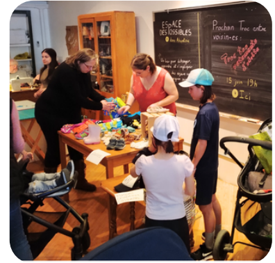
Une soirée Troc tes trucs entre voisin-es à l'EdP d'Ahuntsic

On accompagne la création de tiers-lieux, des espaces communautaires autogérés par les résident-es des quartiers où ils sont implantés. Chaque tiers-lieu inspire et fait vivre des initiatives locales et solutions adaptées aux besoins de son quartier.