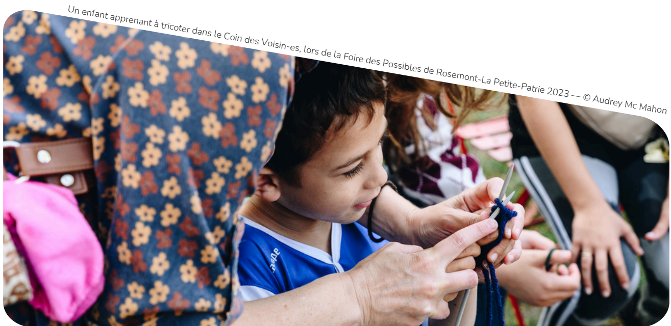
Un enfant apprenant à tricoter dans le Coin des Voisin-es, lors de la Foire des Possibles de Rosemont-La Petite-Patrie 2023

Ils donnent du pouvoir : ce sont des outils qui favorisent la participation et l'implication des gens! Ils déconstruisent certains récits négatifs sur l'action collective et démontrent qu'ensemble, on peut gérer nos ressources autrement, en se basant sur l'intelligence collective et le partage. Ils sont essentiels pour construire une société décroissante, axée sur le bien-être des êtres vivants, qui respecte les limites de la planète et qui garantit un avenir désirable pour toutes et tous.