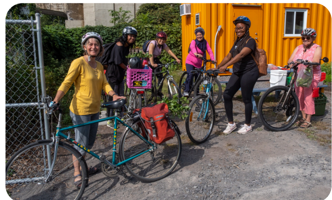
Participant aux balades à vélo pour toutes