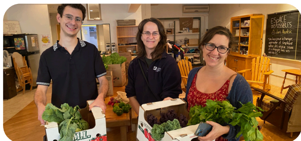
Bénévoles du collectif d'achat de l'Espace des Possibles Ahuntsic