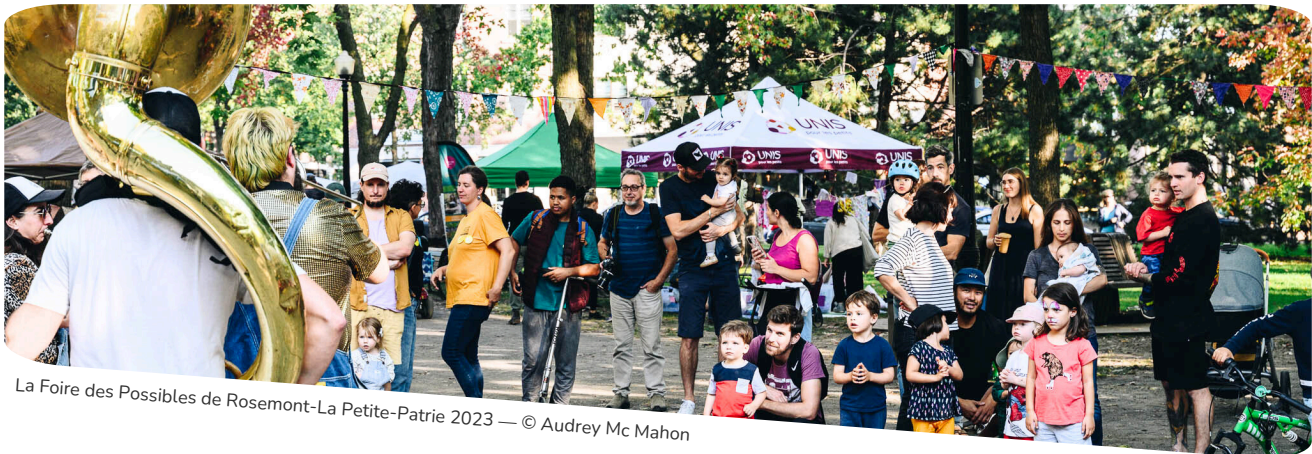
La Foire des Possibles de Rosemont-La Petite-Patrie 2023