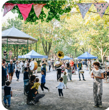
3e édition de la Foire des Possibles dans La Petite-Patrie

On soutient les quartiers, les organismes et les citoyennes qui les composent dans leur transition socio-écologique et on organise des événements favorisant le partage de bonnes pratiques fondées sur les apprentissages ou l'expertise.