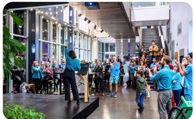
L'annonce de la création de l'OBNL au Gala LocoFolies