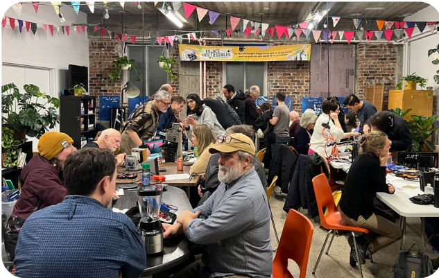
Un repair café à l'Espace des Possibles de La Petite-Patrie