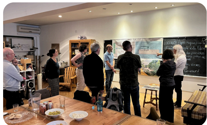
Activité de structuration pour le projet Ligne verte Millen