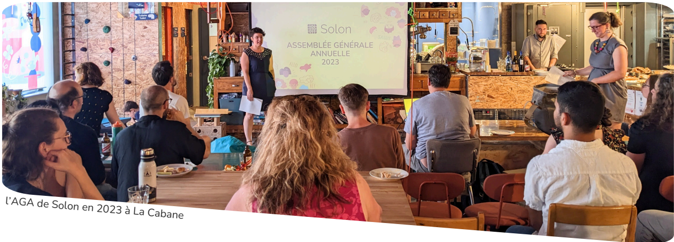
l'AGA de Solon en 2023 à La Cabane