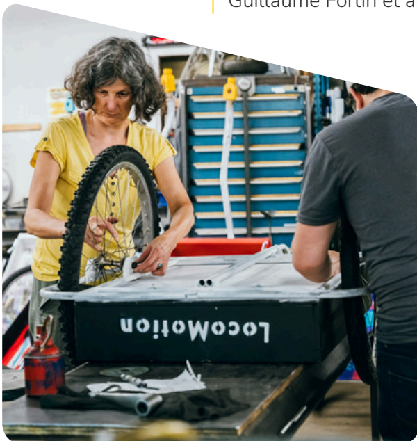
Fabrication de LocoMobiles

Des plans en libre partage ont même été conçus bénévolement par Guillaume Fortin et améliorés par plusieurs membres de LocoMotion!