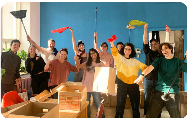
Le déménagement aux ATSE rénovés en novembre 2023