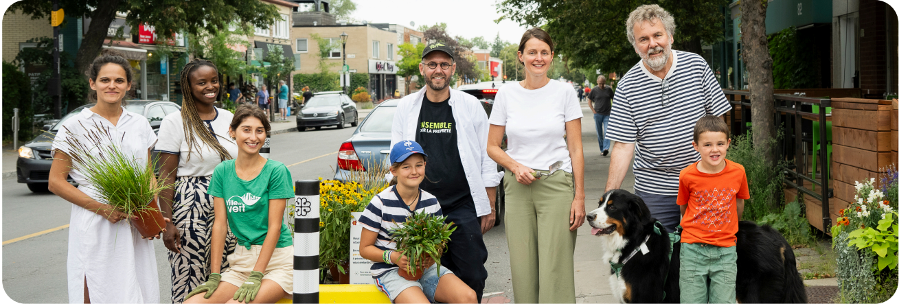
Activité de plantation pour les saillies citoyennes

Solon a encadré l'approche participative, le processus de co-création et de mobilisation, en s'appuyant sur notre ancrage dans le quartier. Notre équipe a agi comme intermédiaire entre les différentes parties prenantes.