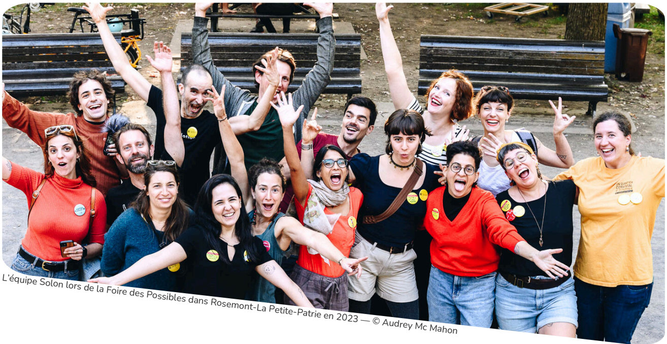
L'équipe Solon lors de la Foire des Possibles dans Rosemont-La Petite-Patrie en 2023