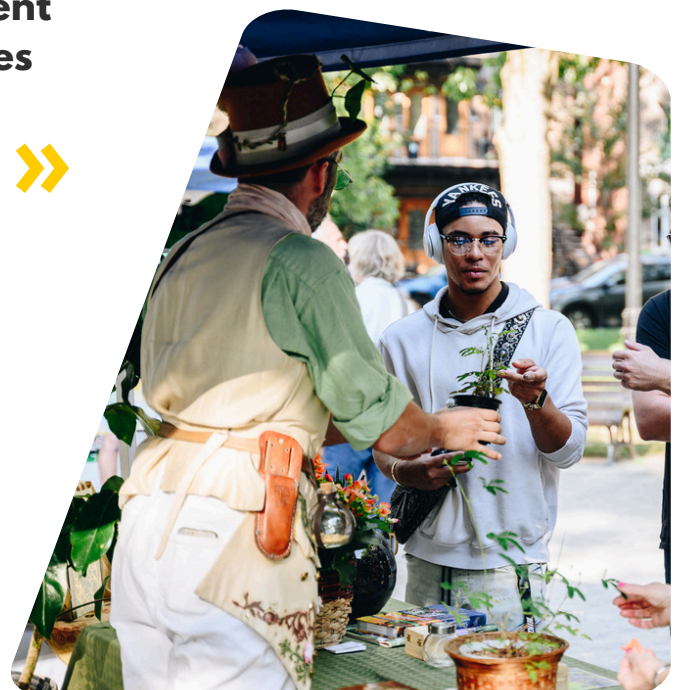
Atelier de plantation à la Foire des Possibles 2023

Nous accompagnons les groupes citoyens et les institutions dans la construction d'une ville plus écologique et solidaire , un quartier à la fois.